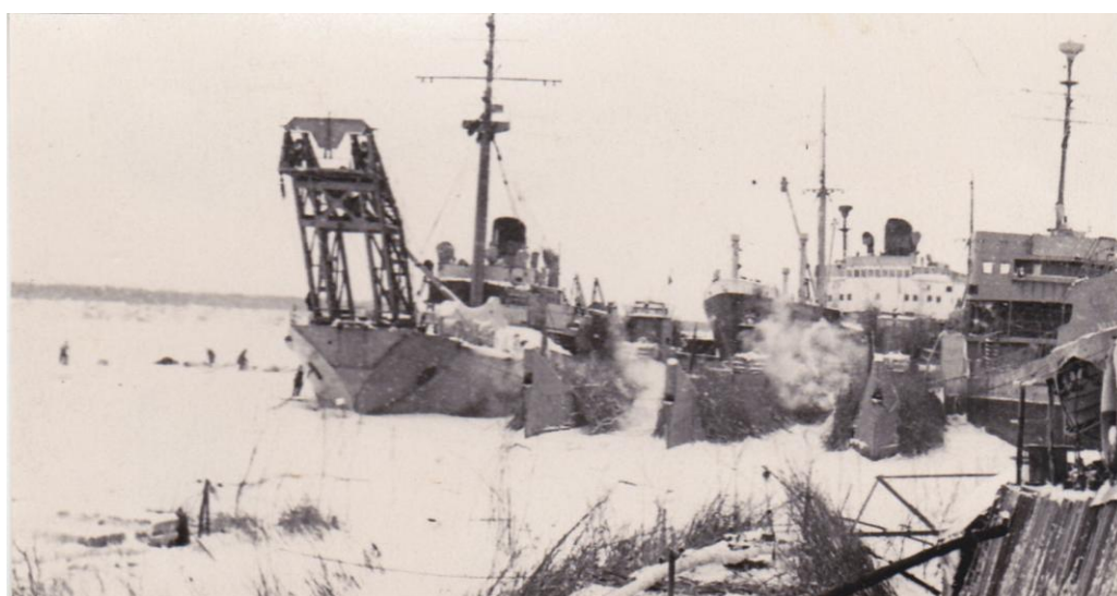
Зимовка лодок на Колыме, 1956 год