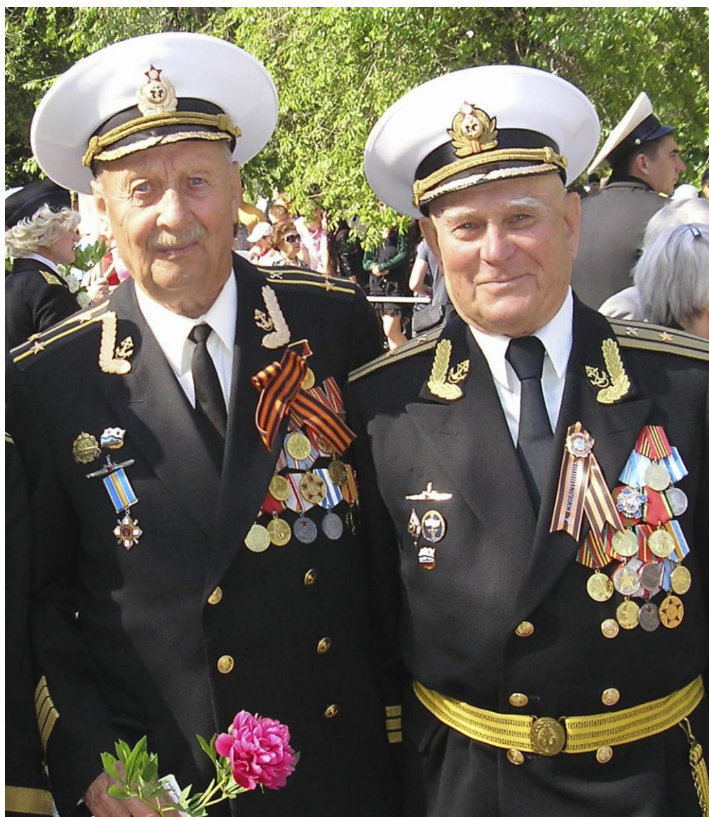
День Победы 2012 год