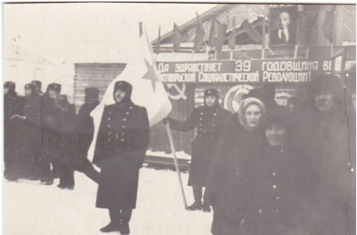
7 ноября 1956 г. п Нижние Кресты Колыма