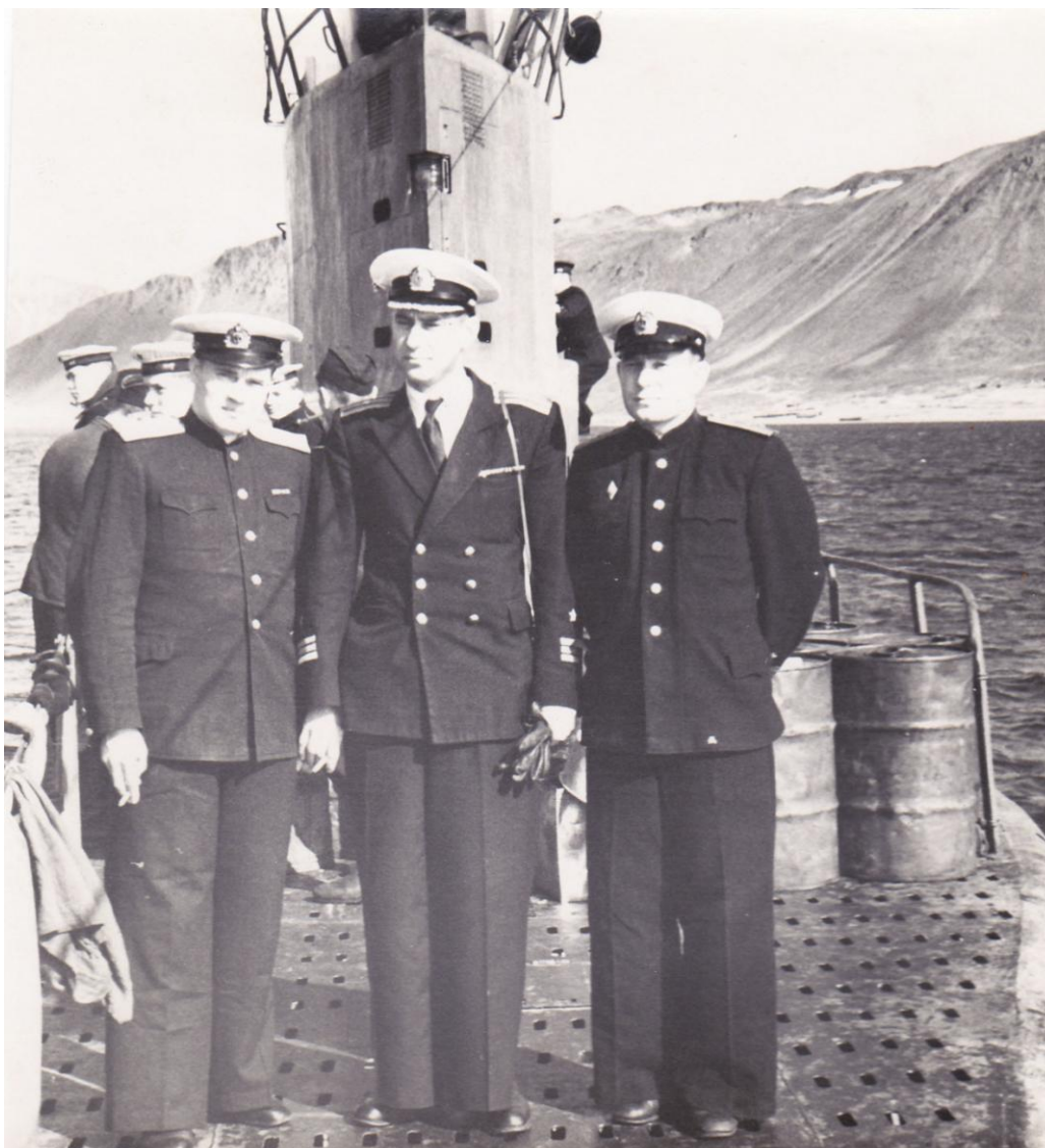
доктор, зам. и я справа. б. Провидения, 1957 год