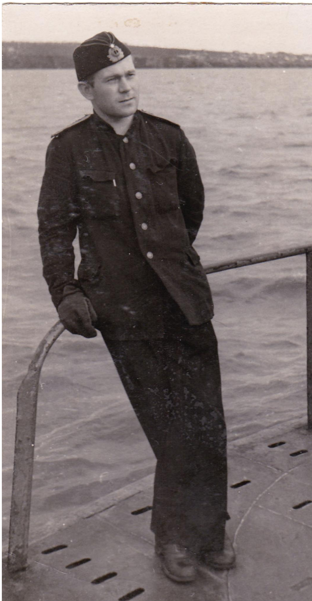
р. Колыма, 1956 год