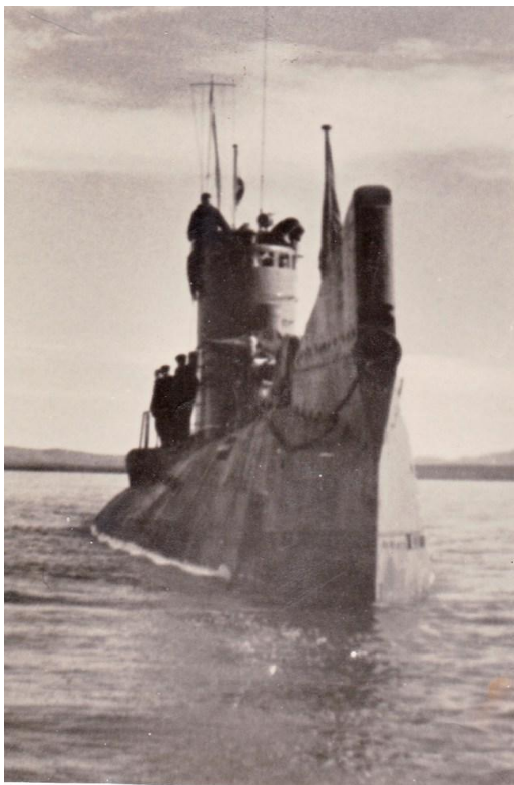
пл «С-198» р. Колыма, 1956 г.